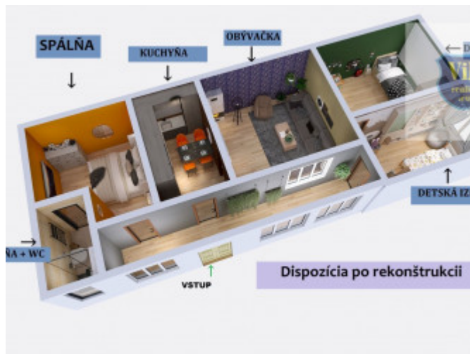
Dispozícia po rekonštrukcii